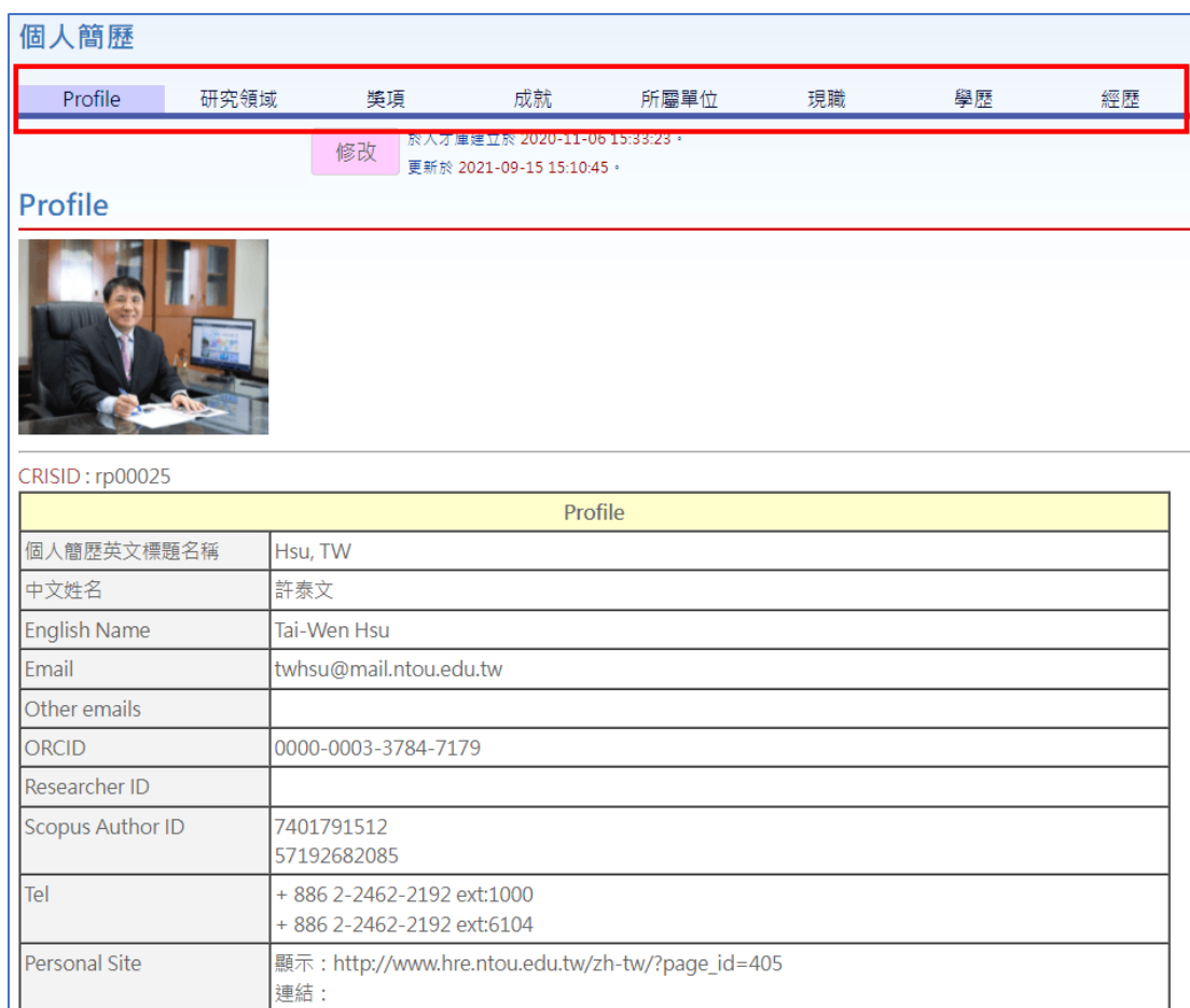
圖 7 對應至人才庫之個人簡歷項目分頁

可透過圖 7 中的項目分頁查看個人簡歷之內容，如需修改，點擊圖 8 標示之「修改」按鈕。